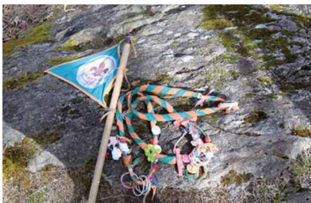
Nella foto, i simboli degli scout

Il branco dura quattro anni e comprende i bambini dagli otto agli undici anni, si focalizza sul gioco e sulla fantasia del libro della giungla. Il reparto dura anch'esso quattro anni e ne fanno parte i ragazzi dai dodici ai quindici anni, in